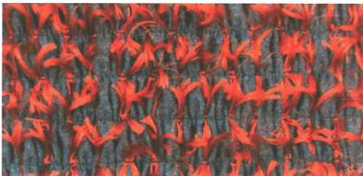
Eccentriche passamanerie realizzate con filati fantasy Eccentric passamanerie made with fantasy yarns