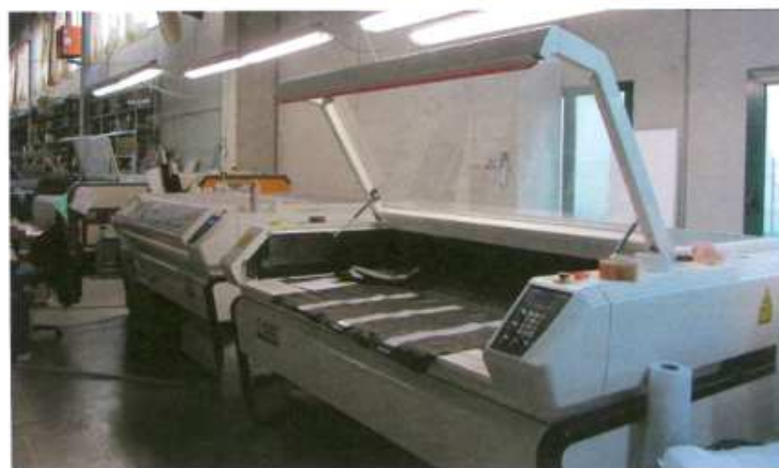
Vedute dello stabilimento Views of the factory